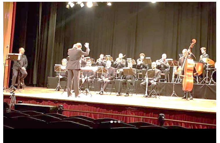
Concert Amics dels Concerts. BALLEM-LA! Cobla Mediterrània 40 anys.

*En el moment d'editar aquesta circular, la representació teatral del Grup de Teatre Eduard Costa encara s'havia fet, i per això no hem pogut posar cap fotografia de l'acte.