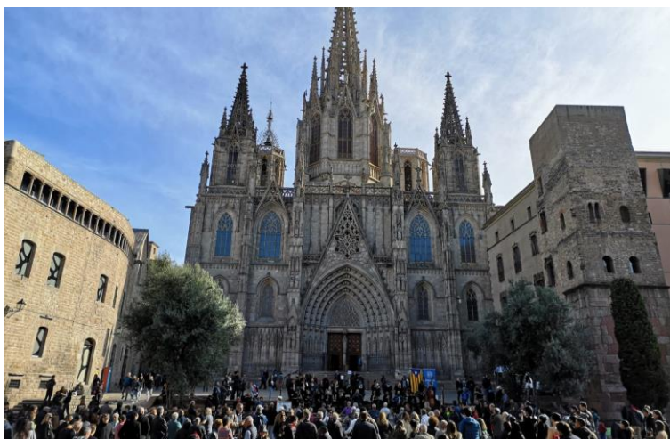
Ballada doble d'aniversari