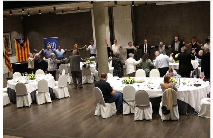
Dinar de Germanor