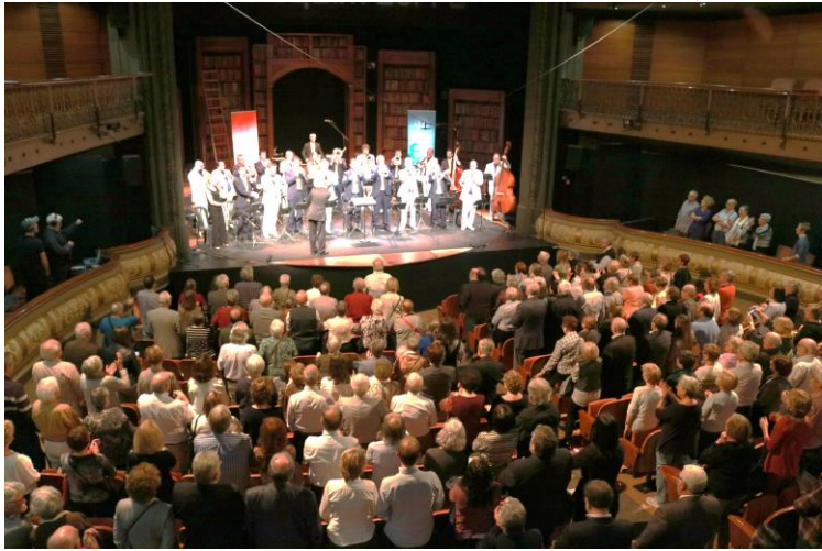
Memorial Joaquim Serra

Us deixem un petit recull de fotografies d'alguns dels actes que hem celebrat durant aquest mes de novembre.