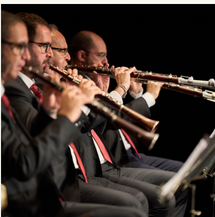
La Cobla Sant Jordi*