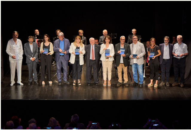
Fotografia dels guardonats*

*Fotografies cedides pel Departament de @cultura_cat