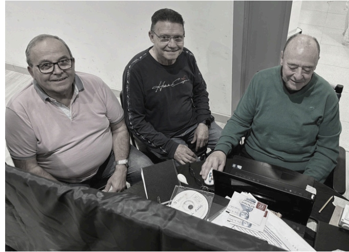
Equip tècnic i direcció